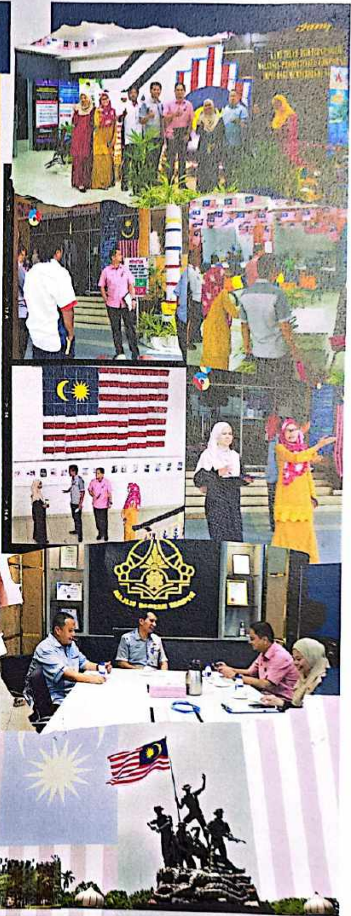
Majlis Daerah Tampin

Majlis Daerah Tampin telah menyertai Pertandingan Keceriaan Bulan Kebangsaan 2023 Peringkat Negeri Sembilan anjuran Kerajaan Negeri Sembilan. Konsep yang diketengahkan oleh MDT tahun ini berdasarkan dengan tema yang diberikan Malaysia Madani "Tekad Perpaduan Penuhi Harapan".